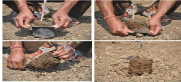
Tearing polythene by hand

पौधे की थैली को इस प्रकार फाडे की पौधे की जडों को नुकसान नहीं हो एवं मिटटी का पिण्ड नहीं बिखरे