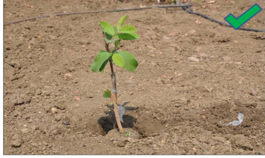
Correct ground level placement of plant

अब गड्ढे में किये गये छेद में पौधा रोप देवें एवं चारों तरफ मिट्टी भरकर सावधानी पूर्वक पूर्ण रूप से इस प्रकार दबा दे कि पौधे की जड़ों को कोई नुकसान न पहुंचे तथा मिट्टी के अंदर हवा का गर्त ना रहें।