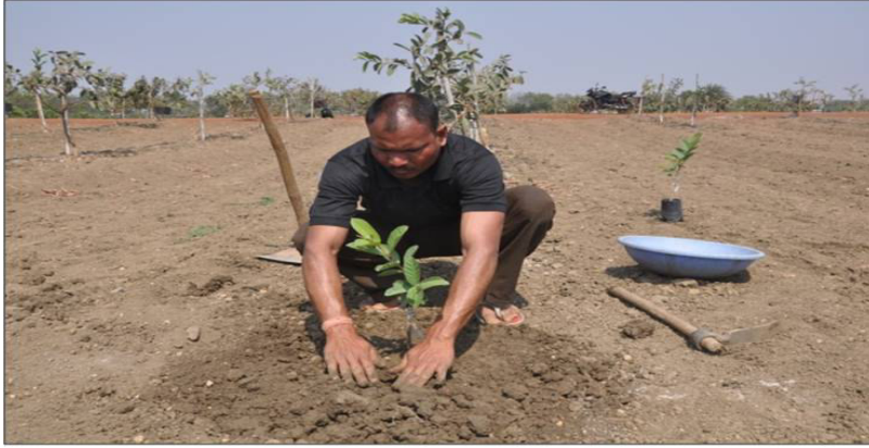
Filling of soil in pit around the plant

अब गड्ढे में किये गये छेद में पौधा रोप देवें एवं चारों तरफ मिट्टी भरकर सावधानी पूर्वक पूर्ण रूप से इस प्रकार दबा दे कि पौधे की जड़ों को कोई नुकसान न पहुंचे तथा मिट्टी के अंदर हवा का गर्त ना रहें।